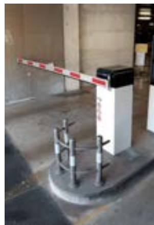
Pista di ingresso / di uscita con lettura targhe