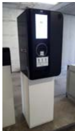
Colonnina all'ingresso per il ritiro del ticket