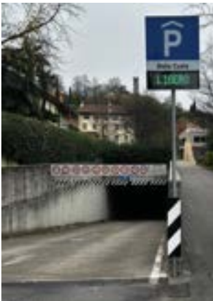
Rampa di ingresso al parcheggio interrato