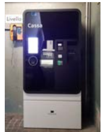
Cassa automatica presente all'interno della struttura